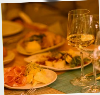
Tapas & DJ 1881 Kantine