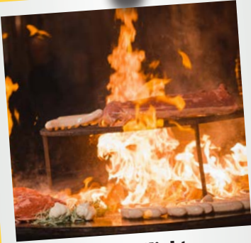
Men's Night Maxililian