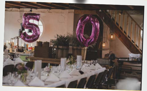
Geburtsanlass La Chapelle